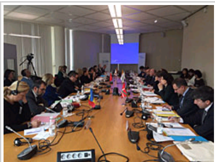
Vista general de la reunión de representantes de la CTP.