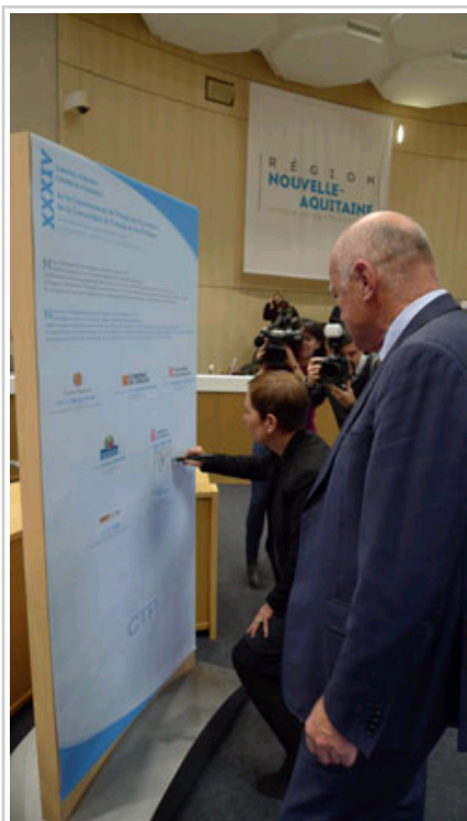
La Presidenta Barkos firma la declaración en presencia del Presidente Rousset.