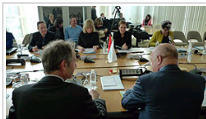
La delegación navarra, encabezada por la Presidenta Barkos, en un momento de la reunión. Enfrente, de espaldas, el Presidente Rousset.