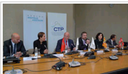
La Presidenta Barkos y el resto de responsables de la CTP, durante la rueda de prensa.