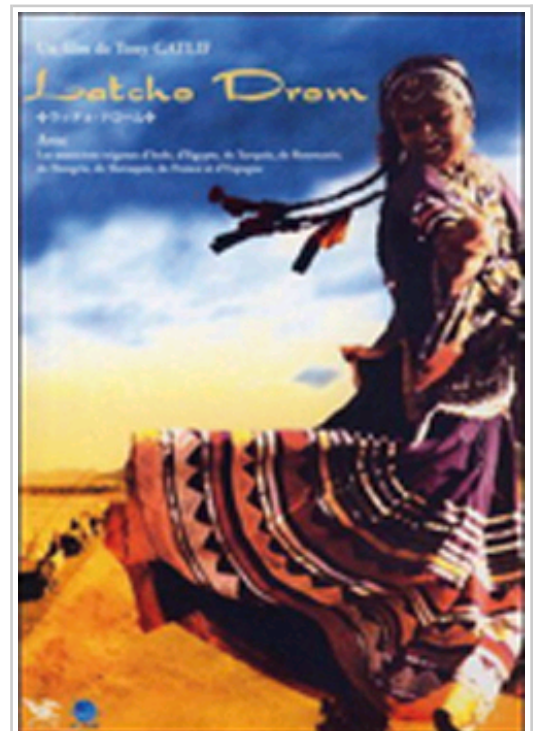
Cartel del documental Latcho Drom ( Buen camino ), Francia, 1993.

Hoy martes, 6 de noviembre, a las 20 h. se proyectará Latcho Drom ( Buen