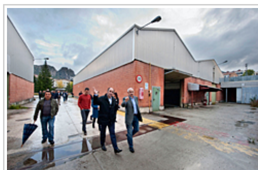
Lehenengo planoan, Ayerdi lehendakariordea eta Nasuvinsako kudeatzailea instalazioetara egindako bisitan.

Ayerdi lehendakariordeak azpimarratu duenez, jarduera honekin, Nafarroako Gobernuak, Irurtzun eta Arakilgo udalen laguntzarekin, eskualdeko industrialde baten sustapenaren buru da, eta lehengo industria-instalazioak birgaitze batetik sortutako Nafarroako lehen industria-jarduera dela nabarmendu du.