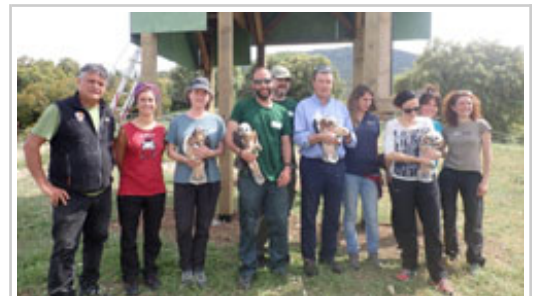
Momento previo a la liberación de los cuatro pollo de águila de Bonelli.

Ayer se presentó oficialmente en la Casa de Cultura de Cáseda, el proyecto AQUILA a-LIFE , que bajo la tutela de la UE y hasta el año 2022 quiere contribuir a la recuperación en el Mediterráneo occidental del águila de Bonelli ( Aquila fasciata ) y a dar la vuelta a su tendencia poblacional regresiva.