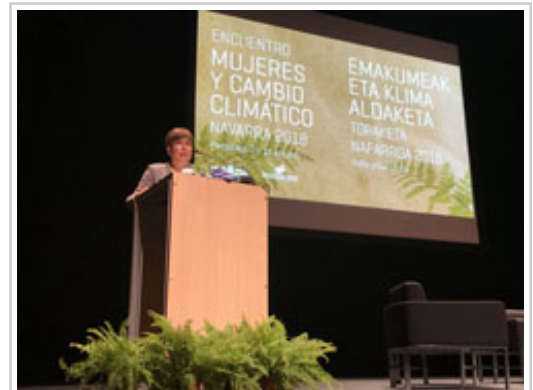
Lehendakariaren agerraldiaren uneetariko bat.