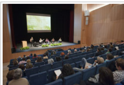
Topaketara bertaratu direnak.