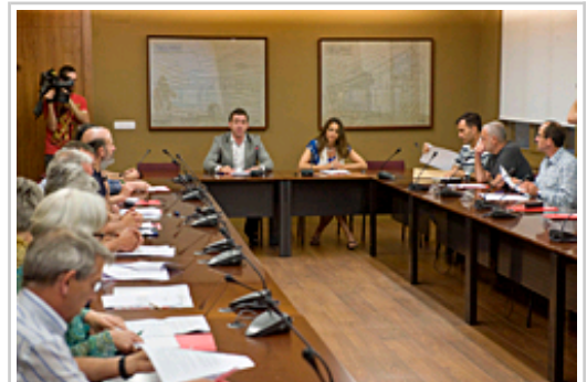
Imagen de la reunión que el vicepresidente Jiménez (en el centro) ha mantenido con representantes de asociaciones de familiares de víctimas de la Guerra Civil.

Durante su intervención, el vicepresidente Jiménez ha destacado que el mapa de fosas de víctimas de la Guerra Civil en Navarra es un “mapa vivo” porque se irá actualizando conforme se recopile más información. El objetivo de esta iniciativa es localizar las fosas comunes,