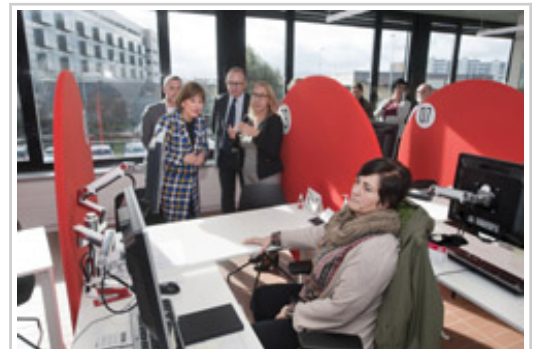
Barkos Lehendakariak Iturrondo agentzi integral bateratuko gela bat bisitatzen.

Lehendakaria, Uxue Barkos, izan da gaur Burlatan kokatutako Iturrondo agentzi integral bateratuaren inaugurazioaren buru. 2.840.000 euroko inbertsioa egin ondoren eta Estatuako Enplegu Zerbitzu Publikoaren 1,26 milioi euroko diru-laguntzarekin, orain arte soilik prestakuntza-zentro bezala erabiltzen zen eraikina enplegurako agentzia integrala izatera igaro da.