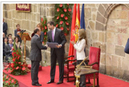
. Innerarity saria Printzearen eskutik jasotzen.