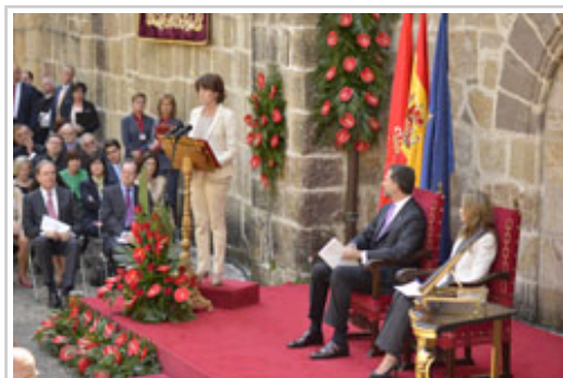
Lehendakaria bertaratutakoan aurrean egindako agerraldian.