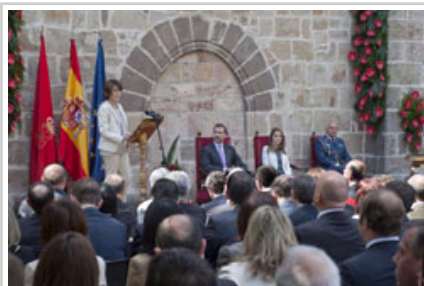
Lehendakaria bere agerraldian.