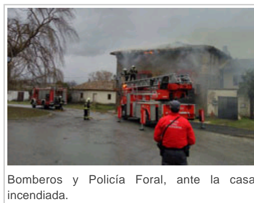
Bomberos y Policía Foral, ante la casa incendiada.

La Policía Foral, que ha contado con el apoyo de los agentes de la Policía Local, han ordenado el tráfico en la zona y se han hecho cargo de la investigación de las causas del suceso, que según los primeros indicios pudo tener su origen en el incendio de una chimenea.