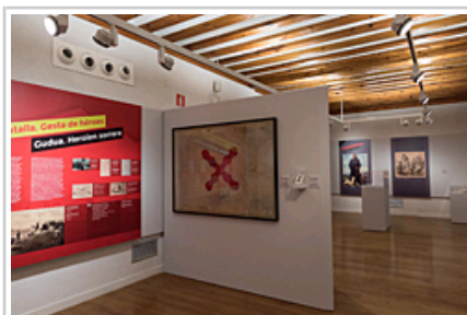
Otra vista de la exposición temporal.