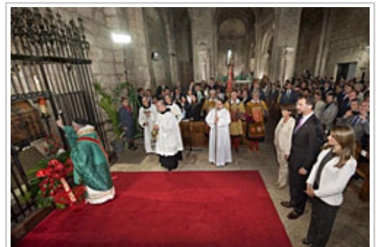
Felipe jaunak Nafarroako Erregeen hilobian eskainitako lore gorrien koroa

Asturiasko eta Vianako printze-printzesa Errege Gorentasunak Leyreko monasterioko elizan Nafarroako Erregeei eskaini zaien Omenaldian parte hartu dute gaur goizean, 2013ko Kulturaren Vianako Printzea Saria Daniel Innerarity-ri emateko egin den ekitaldiaren ondoren. Ospakizun liturgikoa amaitzean, Felipe de Borbón jaunak lore gorritz osatutako koroa utzi du Nafarroako lehen erregeen gorpuzkinak dauden hilobiaren aurrean.