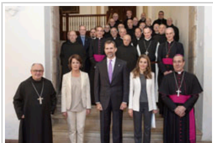
Printze-printzesak eta Barcina Lehendakaria monasterioko monje-