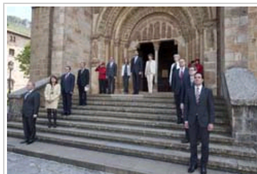
Tenpluaren sarreran osatu den segizioa.

Leyreko ekitaldiak amaituta, Asturiasko eta Vianako printze-printzesak eta gainerako agintariak Castillo de Gorraiz (Eguesibar) jatetxera joan dira bazkaltzera. Honako menu hau dastatu dute: Tuterako zainzuriak eta orburuak, Nafarroako txekor-azpizuna edo itsas zapoa parrillan eta Ultzamako mamia postrean; hori guztia Nafarroako Jatorri Deiturako ardoekin.