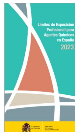
Límites de Exposición Profesional para Agentes Químicos en España INSST