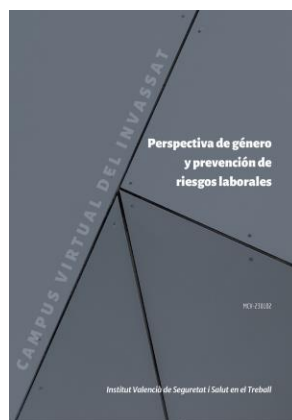
Perspectiva de género y prevención de riesgos laborales INVASSAT

Nafarroako Osasun Publikoaren eta Lan Osasunaren Institutuak (NOPLOI) ez du bere gain hartzen argitaraturiko artikuluen eta albisteen edukirik; izan ere, bere horretan hartu dira kasuan kasuan aipaturiko w ebgunetik, eta ez zaie aldaketarik egin ezta deus erantsi ere. Edozein kontsulta edo iradokizun egin nahi baduzu, edo ez baduzu bidaltzaille honen informazio gehiago jaso nahi, NOPLOIra jo dezakezu, helbide elektronikoa honetara ispln.ufii@navarra.es