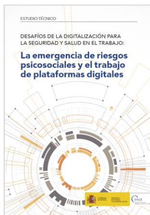
La emergencia de riesgos psicosociales y el trabajo de plataformas digitales INSST