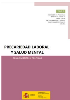
Precariedad laboral y salud mental Ministerio de Trabajo y Economía Social