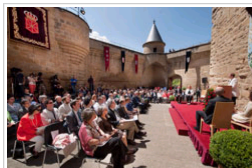
Imagen del acto de entrega del premio correspondiente a 2016.