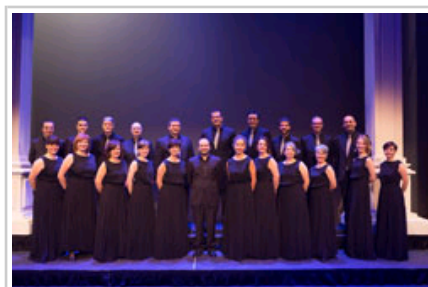
La Coral de Cámara de Pamplona.