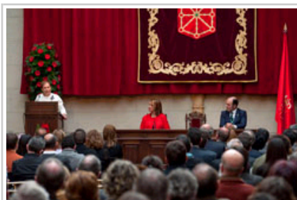
La Presidenta Barkos se dirige a los asistentes al acto.