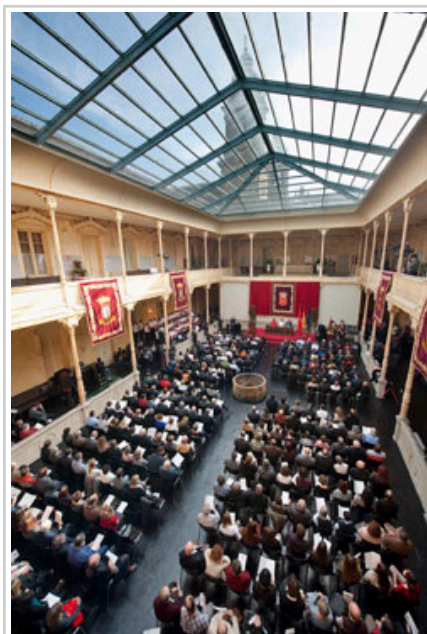
El claustro isabelino ha sido el escenario del acto.