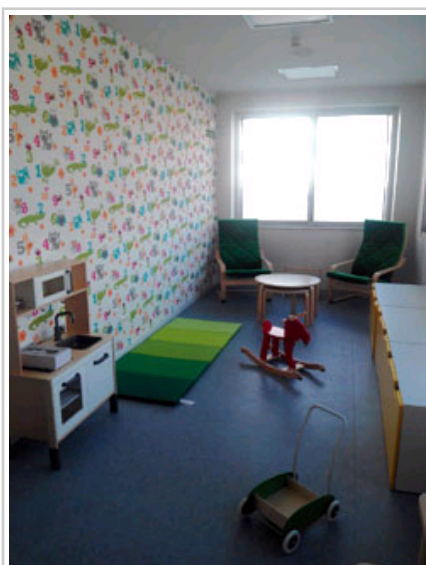
Ludoteca del área de Pediatría del CHN.