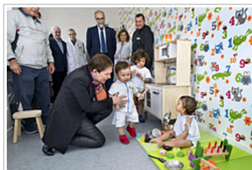
La Presidenta Barkos, en la nueva ludoteca infantil del CHN.

El Complejo Hospitalario de Navarra ha renovado el área de hospitalización de la cuarta planta del edificio materno-infantil en la que cada año ingresan más de 2.600 menores. Las obras, que se han prolongado durante un periodo de cuatro meses, han permitido mejorar de manera considerable las condiciones de hospitalización de la planta así como el espacio de trabajo de los y las profesionales.