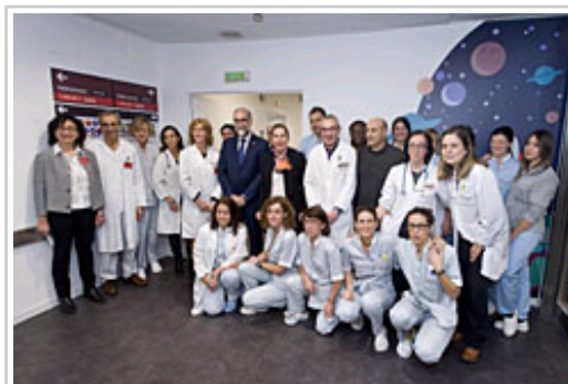
La presidenta Barkos y el consejero Domínguez, con el personal de Pediatría del CHN.

El importe de la obra ha ascendido a 233.526,33 euros, mientras que a equipamiento general se han destinado 42.491,67 euros.