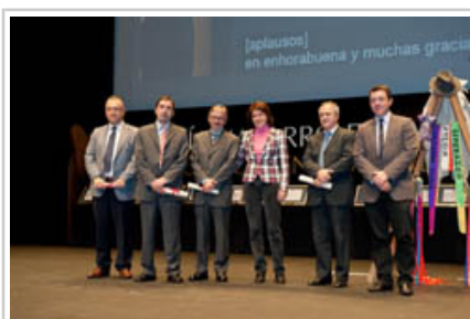
El vicepresidente primero y la consejera Vera tras entregar uno de los galardones.