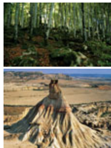
La Selva del Irati y el desierto de las Bardenas.

Navarra es tierra de diversidad. En sus 10.421 km 2 coexisten tres regiones bioclimáticas —Alpina, Atlántica y Mediterránea— que cuentan con 42 hábitats declarados de interés por la Unión Europea. Navarra es líder en sostenibilidad forestal con el 27% de superficie de bosques, lo que supone 136.384 hectáreas de naturaleza en estado puro. Navarra fue una de las primeras regiones del mundo en invertir en energías limpias. En la actualidad el 65% de la electricidad consumida en Navarra se produce con energías renovables: eólica (76,09%), mini-hidráulica (9,25%), biomasa (7,09%), hidráulica (6,57%) y solar (1%). Navarra es conocida por su liderazgo en energía eólica. De hecho, el 1,62% de ese tipo de energía generada en la Unión Europea se produce en Navarra. Los ríos navarros conservan la pureza de una naturaleza en equilibrio. Navarra depura el 97% de sus aguas residuales. Pese a la importancia del desarrollo económico de los últimos años Navarra no ha renunciado al mantenimiento de sus paisajes más bellos. El 8,6% del territorio se encuentra bajo alguna figura de protección medioambiental.