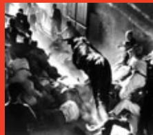
Encierro de los años '50: entrada al callejón.

Hoy, Navarra sigue ofreciendo a quien la recorre los mismos atractivos que enamoraron a Hemingway: la emoción de sus fiestas únicas, la belleza de su naturaleza y de su arte, el placer de una exquisita gastronomía y el afecto hospitalario de un pueblo abierto y amable.