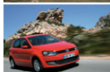
Parque eólico de la Sierra del Perdón y modelo Polo de Volkswagen, fabricado en la planta de Landaben.