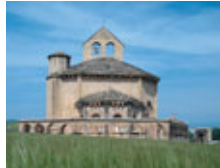
De arriba a abajo, vista del claustro de San Pedro de la Rúa en Estella y ermita Santa María de Eunate.