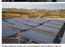
Patio interior bajo el cerramiento fotovoltaico de la fachada principal y captadores solares térmicos en el recinto del Centro Nacional de Energías Renovables (CENER).