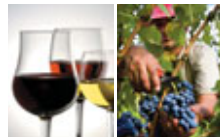
Vino de Navarra y agricultor trabajando en los viñedos de Enéiz.

Los primeros testamentos de la práctica vinícola en Navarra se remontan a la época de la dominación romana. Hoy, el sector vinícola navarro acoge a miles de viticultores y más de 120 bodegas. El cultivo de la vid en Navarra se ubica en un área geográfica privilegiada —entre los montes Pirineos y la fértil ribera del río Ebro— marcada por fuertes contrastes: zonas montañosas y húmedas al norte, valles ondulantes y suaves sierras en el centro, secas llanuras al sur. Esta rica diversidad geoclimática hace posible diferenciar seis zonas vinícolas: Baja Montaña, Tierra Estella, Valdizarbe, Ribera Alta, Ribera Baja y Rioja Baja. Las cinco primeras integran la Denominación de Origen Navarra, que cuenta con 20.000 hectáreas de cultivo, mientras que la última se integra en la D. O. Calificada Rioja, y la forman ocho municipios del sureste de Navarra, en los que se cultivan 6.000 hectáreas. El 70% del vino elaborado en la Denominación de Origen Navarra es tinto, el 24% es rosado, el 5% es blanco y el 0,33% es moscatel. También hay un pequeño espacio para el cava, elaborado en el sur de Navarra. Y en cuanto a las variedades de uva, predomina la variedad tempranillo (37%), seguida de la garnacha (25%), cabernet sauvignon (15%), merlot (13%) y, en menor medida, chardonnay y otras.