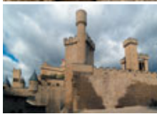
De arriba a abajo, imágenes de la fachada de Santa María la Real de Sangüesa, Monasterio de la Oliva, pórtico de la catedral de Tudela y Castillo de Olite.