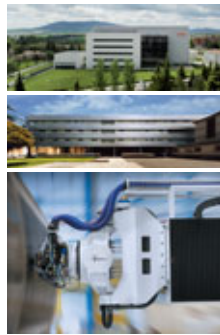
El Centro de Investigación Médica Aplicada (CIMA), el centro de Cardiología del Hospital de Navarra y la factoría de M Torres.

Navarra cuenta con 14 Centros Tecnológicos. Desde el año 2000, se han puesto en marcha en Navarra tres Planes Tecnológicos donde la innovación se ha convertido en su principal señal de identidad. Navarra dedica el 1,9% de su PIB a I+D+i lo que la posiciona en el segundo lugar en el ranking de regiones españolas. Destaca la elevada aportación del sector empresarial privado, que contribuye con el 67,8% de la inversión total en I+D+i. El 30,45% de las empresas navarras realizan actividades de innovación tecnológica. Navarra, con un 22% de personal altamente cualificado en ciencia y tecnología con edades comprendidas entre los 25 y los 34 años, ocupa el puesto 19 de las 271 regiones europeas. Con un 17,5% del empleo dedicado a I+D+i, no es de extrañar que Navarra sea la región española con más patentes por habitante. Destaca su actividad en el sector de biofarmacos, con un 20% de las patentes nacionales.