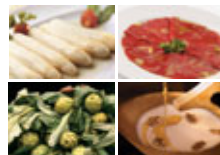
Productos típicos de la gastronomía navarra: espárragos, pimientos del Piquillo, alcachofas y cajuada.