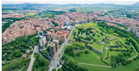
Pamplona, vista del entorno amurallado de la Ciudadela.

Navarra tiene un Índice de Desarrollo Humano de 0,972 —Índice de Naciones Unidas que combina los niveles de sanidad, educación y renta per cápita—, uno de los primeros del mundo. En términos de renta per cápita, Navarra ocupa el puesto 34 de las 271 regiones de la Unión Europea, superando la media en un 30,8%. La esperanza de vida media de los navarros y navarras es de 82,2 años. Su sistema sanitario ocupa el primer puesto de España y el decimoquinto de Europa en número de médicos: 21,14 por cada 10.000 habitantes. La Comunidad Foral de Navarra apuesta por la formación de los más jóvenes. Cuenta con un elevado presupuesto por alumno (3.684,16 €), presenta bajas cifras de abandono escolar prematuro (12%) y obtiene las mayores tasas de titulados en bachillerato de España (50,5%). Navarra cuenta con más de 25.000 estudiantes universitarios. El 36,9% de la población adulta tiene un título superior frente al 26,3% de la OCDE. La Universidad de Navarra y la Universidad Pública de Navarra lideran los rankings españoles tanto en docencia como en investigación. El gasto público en cultura en Navarra por habitante es de 127,5 €, frente a los 41,3 € en el conjunto de España.