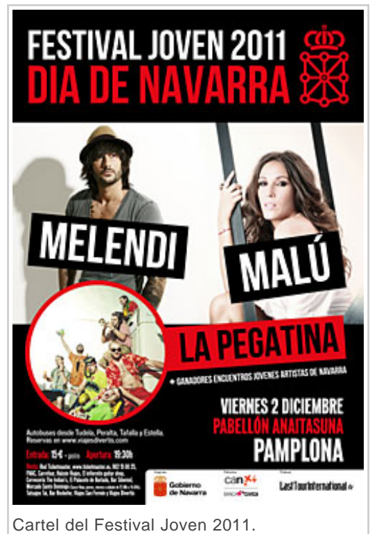
Cartel del Festival Joven 2011.

Melendi es considerado como uno de los artistas clave de la música nacional de la última década. Se dio a conocer con su disco "Sin noticias de Holanda", una mezcla de fusión, rumba, letras callejeras, rock