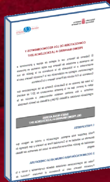
Bases de la Convocatoria 2017