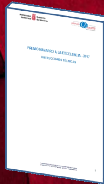
Instrucciones Técnicas 2017