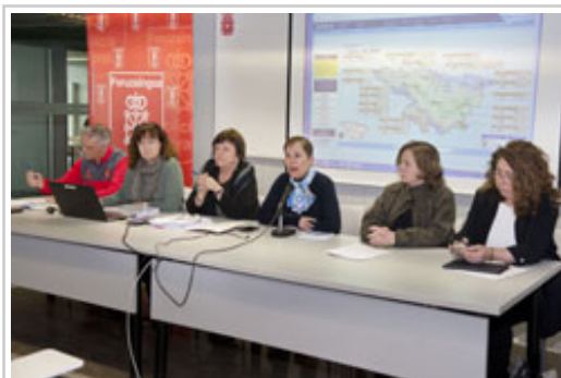
La Presidenta Uxue Barkos durante la reunión con representantes municipales de la Ribera.