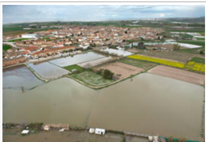
El río Ebro desbordado a su paso por Buñuel.