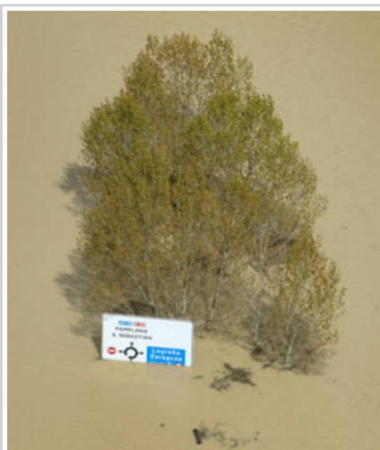
Señal de la carretera de Castejón.