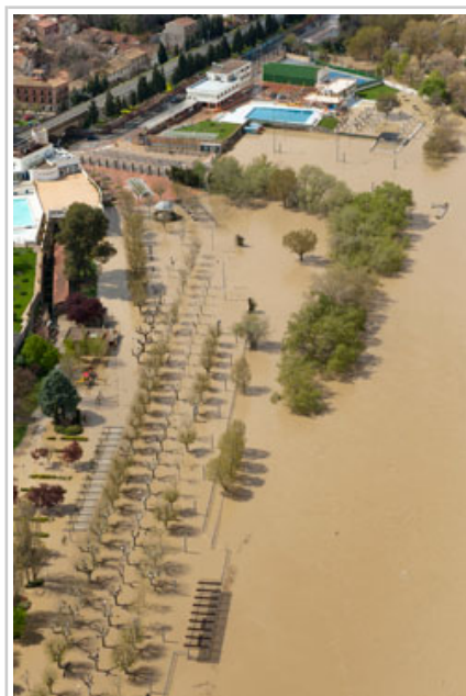
Paseo del Prado de Tudela.