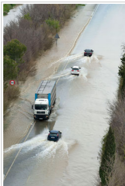
Recta de Arguedas.