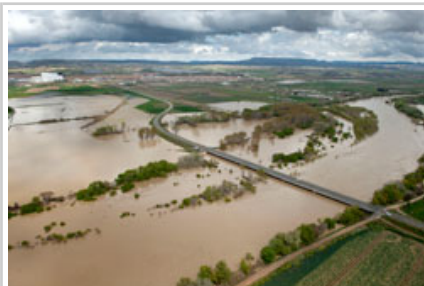
Campos inundados en Fustiñana.