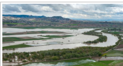
Terrenos entre Fustiñana y Buñuel.