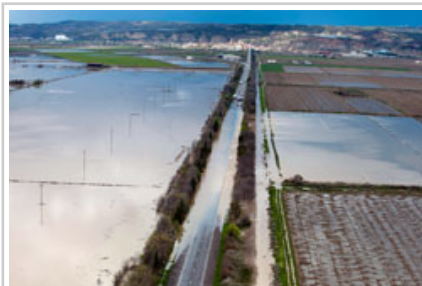
La recta de Arguedas y los campos próximos.