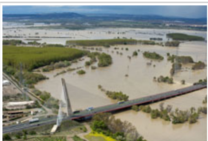
El puente de Castejón.