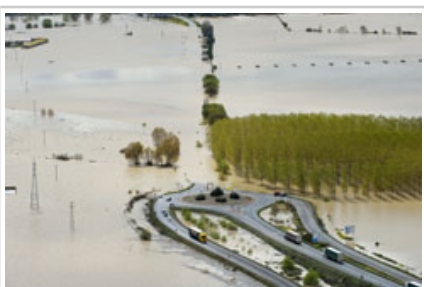
Campos anegados en Castejón.