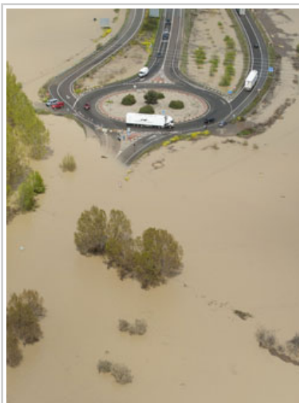
Rotonda de Castejón.