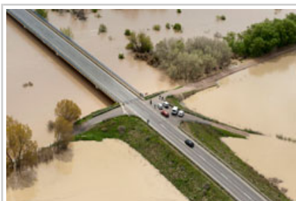
Cruce de carreteras en Cabanillas.