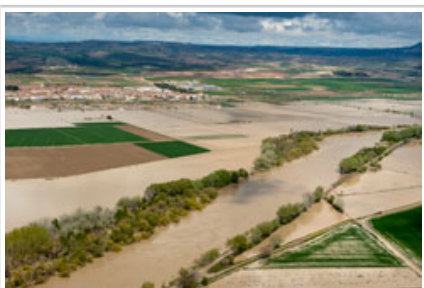
El desbordamiento en tierras de Cabanillas.