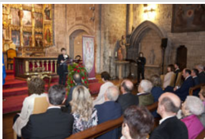
Uxue Barkos Lehendakaria hitzaldian.