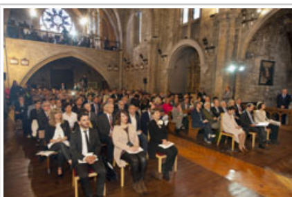
Gobernuko eta nafarroako ordezkariak ekitaldian.