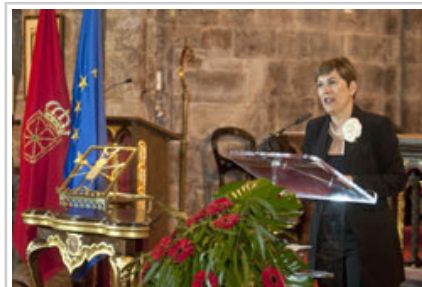
Uxue barkos Lehendakaria.