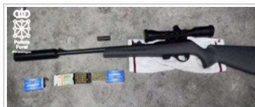
Rifle propiedad de los denunciados que carece de autorización.

Los investigadores recogieron diversos cadáveres de animales para su necropsia, así como posibles cebos envenenados. Las pesquisas se centraron en los lugares donde habían aparecido los animales, así como en aparcamientos cercanos y