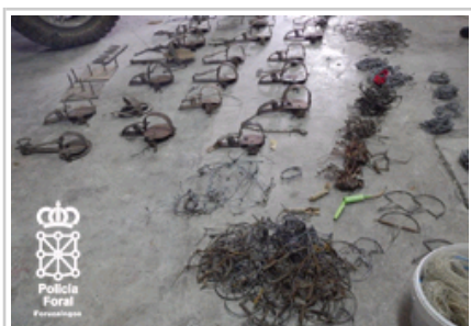
Los cepos encontrados en la operación.