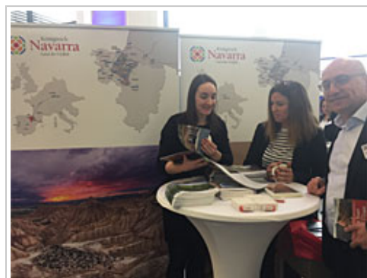
Nafarroako standa Frankfurtan.

Turismo-eskaintzari buruzko informazioa eman da Nafarroako standean, alemanez eta ingelesez. Horretaz gain, Foru Komunitateko informazio orokorra ere zabaldu da, datu demografikoak, bizitza-estandarrak edo ekonomia ireki eta industrialia izatea kasu, zeinak turismoan daukan bere garapen-estrategikorako ardatzetako bat. Baliabide turistikoak dagokienez, bereziki nabarmendu dira Santiago Bidea, tokiko kalitatezko produktuetan oinarritutako gastronomia, folklore aberatsa eta landa-turismoko eta natura-turismoko eskaintza aberats bat.