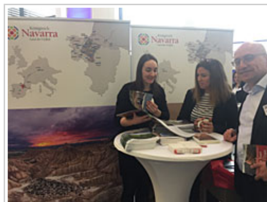
Stand de Navarra en Fráncfort.

En el stand de Navarra, se ha facilitado información en alemán e inglés sobre la oferta turística. También, información general de la Comunidad Foral como datos demográficos, estándares de vida o el hecho de tratarse de una economía abierta e industrial que tiene en el turismo uno de los ejes de su estrategia de desarrollo. En cuanto a los recursos turísticos se ha hecho especial hincapié en el Camino de Santiago, en una gastronomía puntera basada en productos autóctonos de calidad, así como en un rico folclore y en una atractiva oferta de turismo rural y de naturaleza.