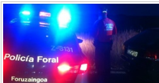
Momento de la intervención

Tras ser identificado, y al contar con múltiples antecedentes policiales, solicitaron apoyo a una patrulla de Tafalla puesto que además presentaba síntomas de haber consumido anfetamina. En el cacheo se le intervinieron sustancias estupefacientes