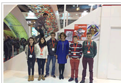
Barcina Lehendakaria eskolako lehiaketan sarituak izan diren ikasleekin.