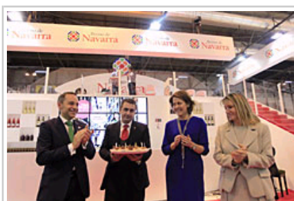
Agintariak Reyno de Navarra turismo-markaren hamargarren urteurrena ospatzen.