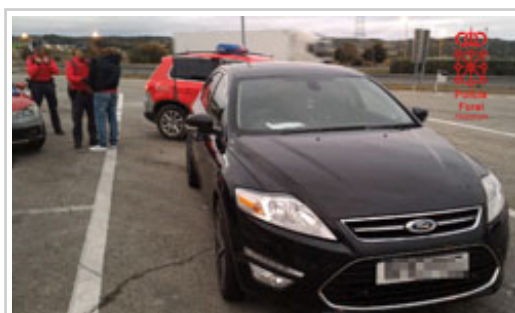
Los agentes en el momento de interceptar al presunto autor

Agentes de la Policía Foral, adscritos a Seguridad Vial Tudela, han detenido a un varón de 47 años, de nacionalidad argelina y con residencia en Londres, como presunto autor de un delito de conducción sin haber obtenido nunca autorización y de un delito de falsedad documental.