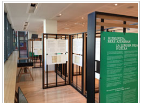
Irailaren 27a bitartean izango da erakusketa ikusteko aukera.

"Navarrorum. Euskararen gaineko dokumentu nafarren bi mila urteko ondarea" erakusketa Bruselako Eskualdeetako Komitera eraman du Nafarroako Gobernuak, Hizkuntzen Europako Egunaren testuinguruan. Erakusketa dokumentala, hizkuntza honek Antzinako Erromatik XIX. mendera arte izan duen agerpena jasotzen duena, irailaren 27ra arte bisitatu ahal izango da.