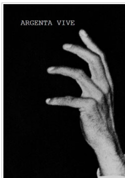
Cartel de la película "Argenta vive" de Pablo Iraburu y Migueltxo Molina.