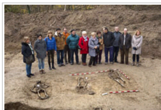
Ollo kontseilaria, senideen bila dabiltzan bilobekin, Aranzadiko kideekin, AFFNA eta Oltza Zendeakoeekin.

Aranzadi Zientzia Elkarteak beste bospasei egunez luzatuko ditu gorpuak topatzeko eta hobitik ateratzeko lanak Iberoko Zurbau parajea. Memoria historikoaren familia eta elkartearen ikerketek adierazten dutenez, toki horretan 25 eta 30 pertsona arteko gorpuzkiak egon daitezke 1978an Larragako herritarrek topatutako hogeitabat gorpuri erantsita. Oraingoan, lau gorpu oso aurkitu dira.