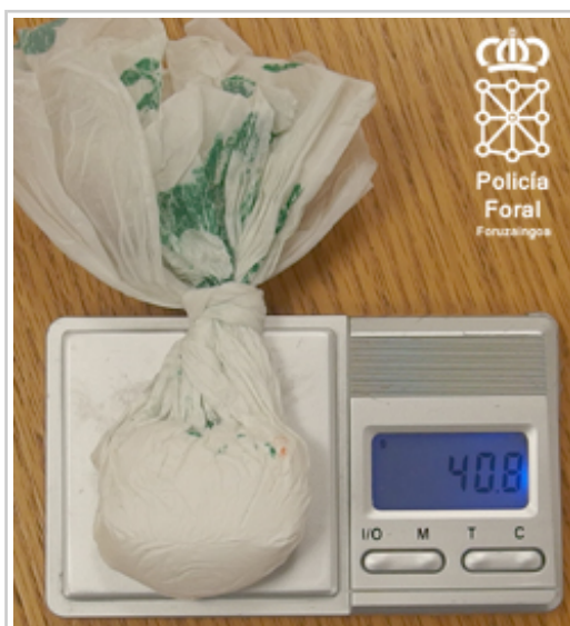
Droga incautada en el maletero

Hasta el lugar se desplazaron agentes de tráfico de la comisaría de Tudela que realizaron las pruebas de detección de drogas del conductor, que resultaron positivas en cannabis, cocaína y anfetamina-metanfetamina, por lo que se le denunció administrativamente por conducir habiendo consumido sustancias estupefacientes. Además, entre sus