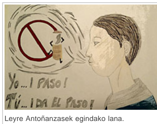
Leyre Antoñanzasek egindako lana.

14-29 urte arteko gazteentzat egindako Nafarroako 2013-2014 Gazteria Inkestaren arabera, tabakoa erretzen 15,3 urterekin hasten dira gazteak, eta egunero erretzen 16,5 urterekin, batez beste. 10 gartzetatik 6k ez du inoiz erre; aldiz, 10etik 2k egunero erretzen du. Egunero erretzen duten gazteen portzentajea 21,3 da, 8,7 zigarro erreta batez beste; eta zifra horrek gora egiten du adinean aurrera egin ahala. 14 eta 17 urte arteko taldean, nesken portzentajea mutilena halako bi da (10,2 eta 5,3, hurrenez hurren).