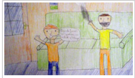
Iker Ezpeletaren marrazki finalista.