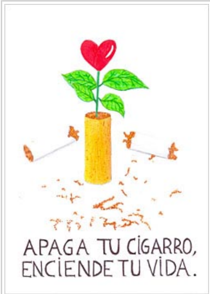
Alba Fernándezen lan irabazlea.